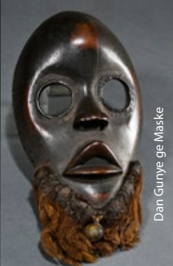
Dan Gonye ge Maske