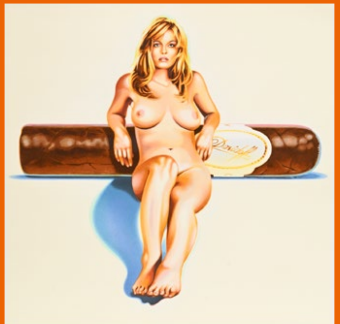
Mel Ramos „Hava-a-Havana IV (Davidoff)“, Farblithographie, 40/199

Abweichungen vom Zeitplan sind möglich! Zur Versteigerung kommen, im Auftrag der Testamentsvollstrecker sowie im Auftrag von Erben und freiwilligen Auftraggebern, Antiquitäten und Kunstgegenstände.