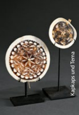
Kapcaps und Tema