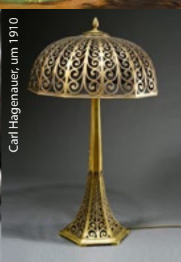
Carl Hagenauer, um 1910