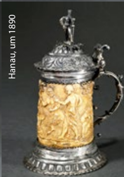
Hanau, um 1890