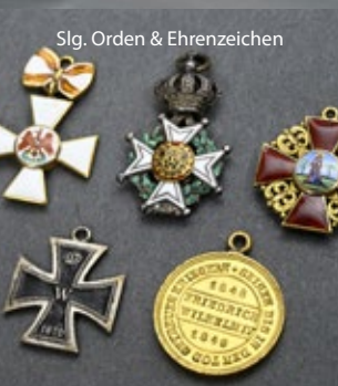
Slg. Orden & Ehrenzeichen