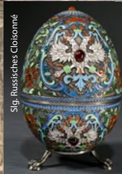
Slg. Russisches Cloisonné