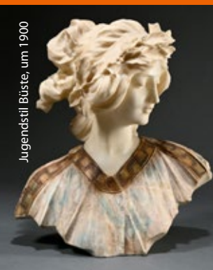
Jugendstil Büste, um 1900