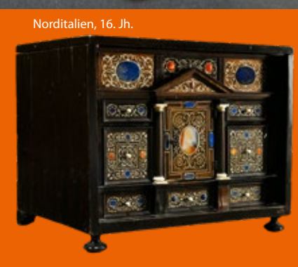
Norditalien, 16. Jh.