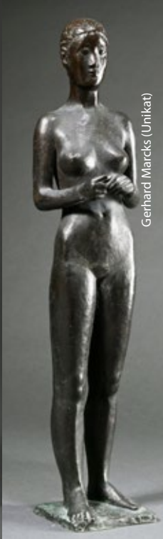
Gerhard Marcks (Unikat)