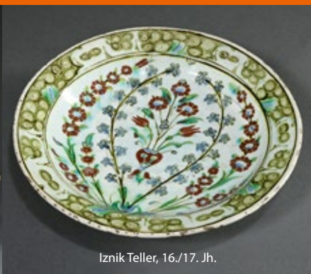
Iznik Teller, 16./17. Jh.