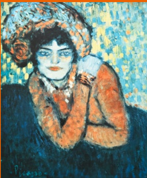
Pablo Picasso „Erwartung“, 1966, Farboffsetlithographie, 3/60