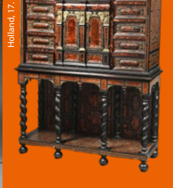
Holland, 17. Jh.