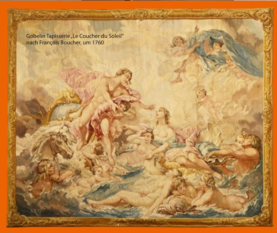
Gobelin Tapisserie „Le Coucher du Soleil“ nach François Boucher, um 1760