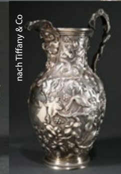
nach Tiffany & Co