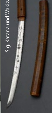
Slg. Katana und Wakizashi