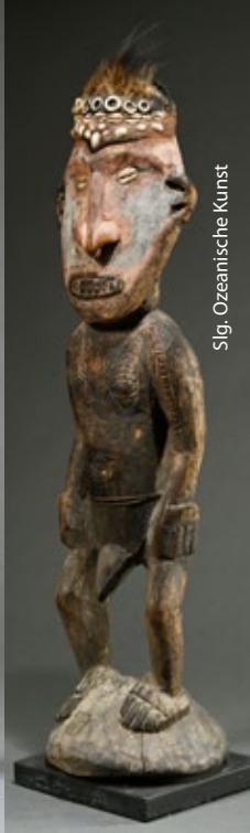
Slg. Ozeanische Kunst