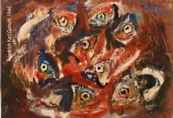
Friedrich Karl Gotsch, 1946