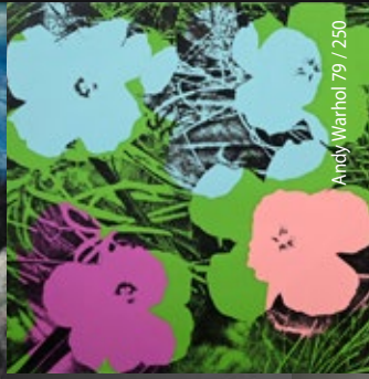
Andy Warhol 79 / 250