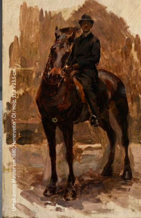
Unbekannter Meister um 1880, „Herrenreiter“, Öl/Holz, 33,3 x 23,5 cm