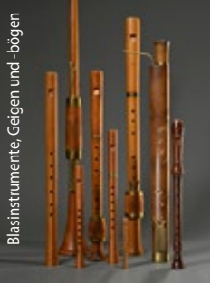
Blasinstrumente, Geigen und -bögen