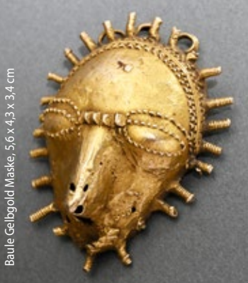
Baule Gelbgold Maske, 5,6 x 4,3 x 3,4 cm