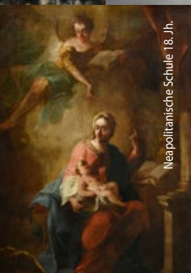
Neapolitanische Schule 18. Jh.