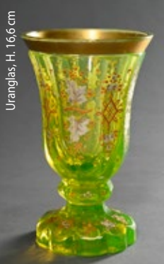
Uraglas, H. 16,6 cm