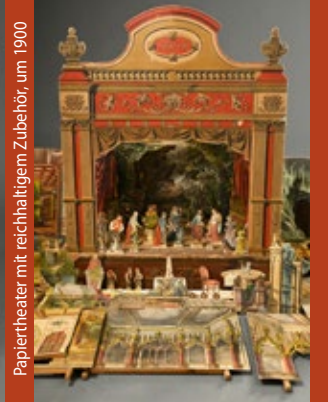
Papiertheater mit reichhaltigem Zubehör, um 1900