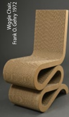
Wiggle Chair Frank O. Gehry 1972