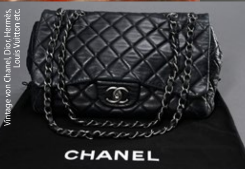
Vintage von Chanel, Dior, Hermès, Louis Vuitton etc.