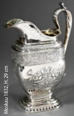
Moskau 1832, H. 29 cm