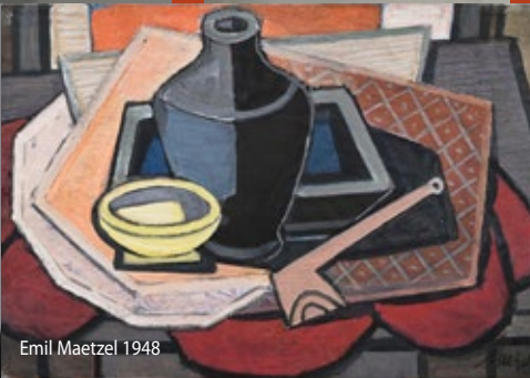
Emil Maetzl 1948