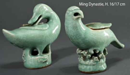
Ming Dynastie, H. 16/17 cm