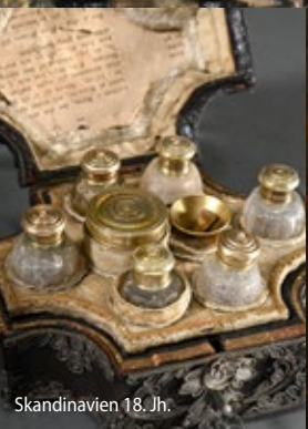
Skandinavien 18. Jh.