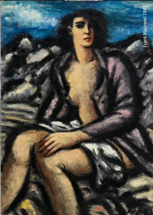
Frans Masereel | 1947