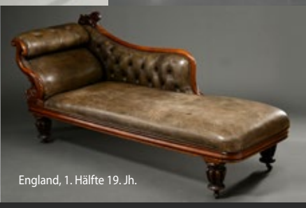
England, 1. Hälfte 19. Jh.