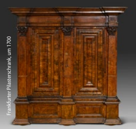
Frankfurter Plasterschrank, um 1700