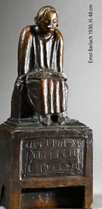
Ernst Barlach 1930, H. 48 cm