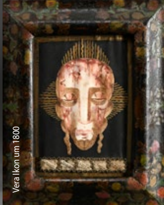
Vera Ikon um 1800