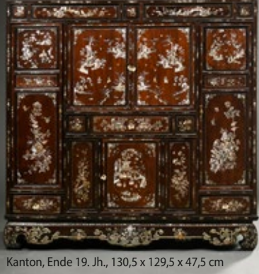
Kanton, Ende 19. Jh., 130,5 x 129,5 x 47,5 cm