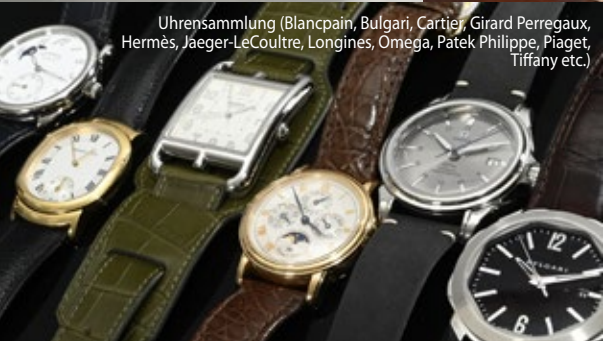
Uhrensammlung (Blancpain, Bulgari, Cartier, Girard Perregaux, Hermès, Jaeger-LeCoultre, Longines, Omega, Patek Philippe, Piaget, Tiffany etc.)