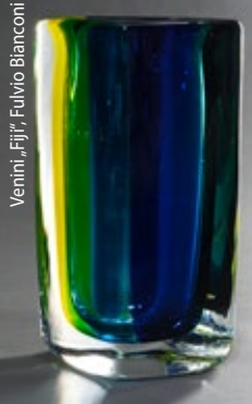
Ventini „Fiji“, Fulvio Bianconi