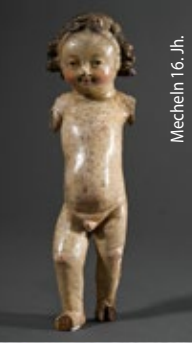
Mecheln 16. Jh.