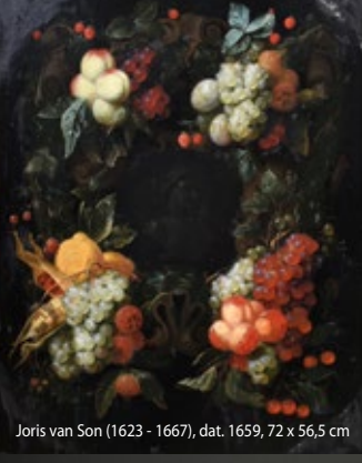
Joris van Son (1623 - 1667), dat. 1659, 72 x 56,5 cm