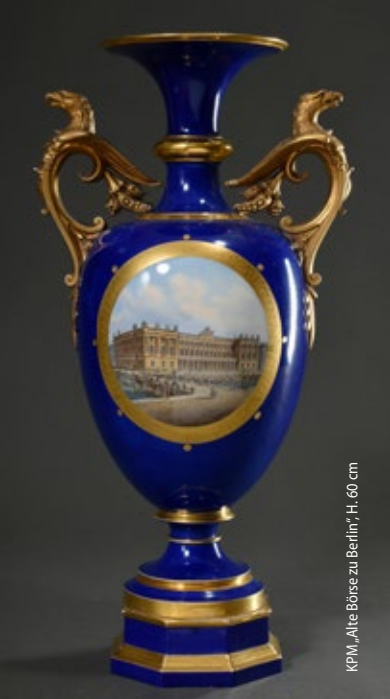
KPM, „Alte Börse zu Berlin“, H. 60 cm