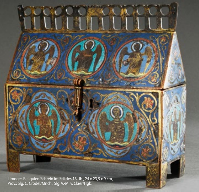
Limoges Reliquien Schrein im Stil des 13. Jh., 24 x 23,5 x 9 cm, Prov.: Slg. C. Cordel/Mnch., Slg. V.-M. v. Claer/Hgb.