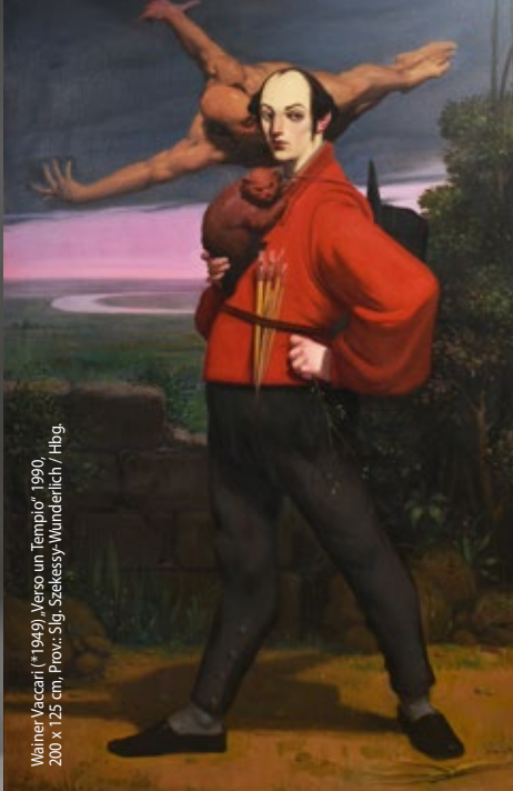
Wainer Vaccari (*1949) „Verso un Tempio“ 1990, 200 x 125 cm, Prov. Slg. Szekessy-Wunderlich / Hbg.