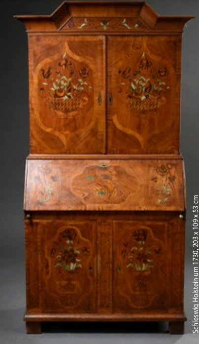
Schleswig Holstein um 1720, 203 x 109 x 53 cm