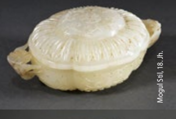
Mogul Stil, 18. Jh.