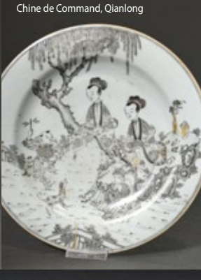
Chine de Command, Qianlong