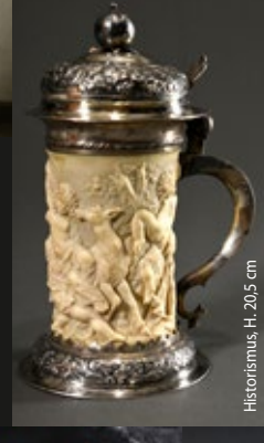
Historismus, H. 20,5 cm