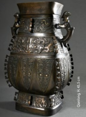
Qiantong, H. 45,5 cm