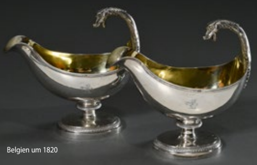
Belgien um 1820