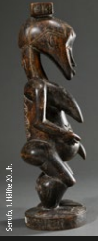
Senufo, 1. Hälfte 20. Jh.