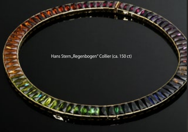
Hans Stern „Regenbogen“ Collier (ca. 150 ct)