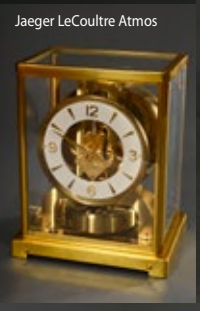
Jaeger LeCoultre Atmos