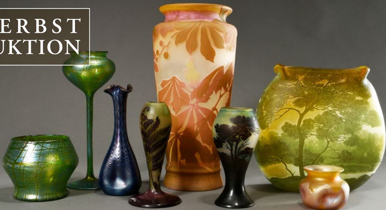
Sammlung Jugendstil Glas von Galle, Daum und Loetz (H. bis 43,5 cm)