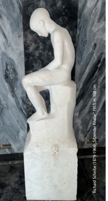
Richard Scheibe (1879-1964), Sitzender Knabe, 1955, H. 1,68 cm