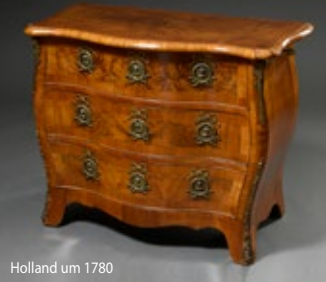
Holland um 1780