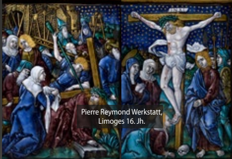
Pierre Reymond Werkstatt, Limoges 16. Jh.