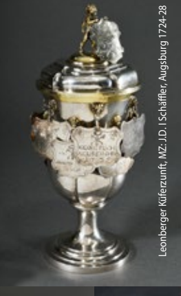
Leonberger Kieferzunft, MZ, J.D., Schäffler, Augsburg 1724-28