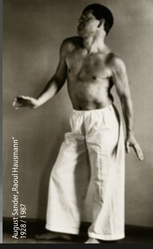
August Sander, Raoul Hausmann 1928 / 1927