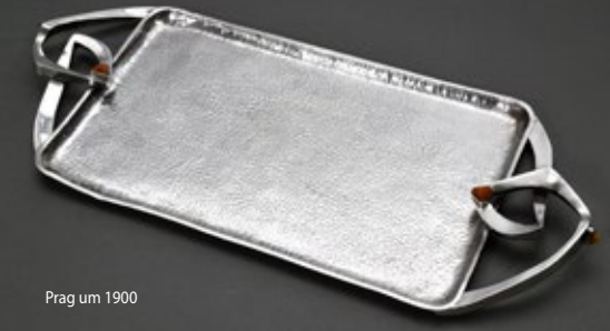
Prag um 1900