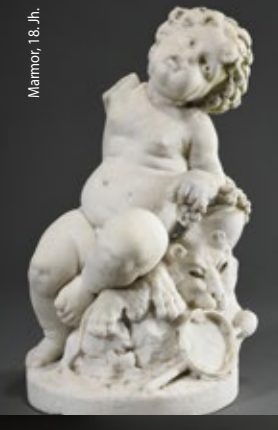
Marmor, 18. Jh.