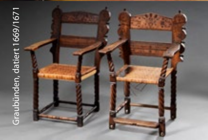
Graubünden, datiert 1669/1671