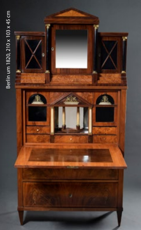
Berlin um 1820, 210 x 103 x 45 cm