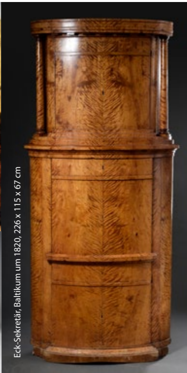
Eck-Sekretär, Baltikum um 1820, 226 x 115 x 67 cm