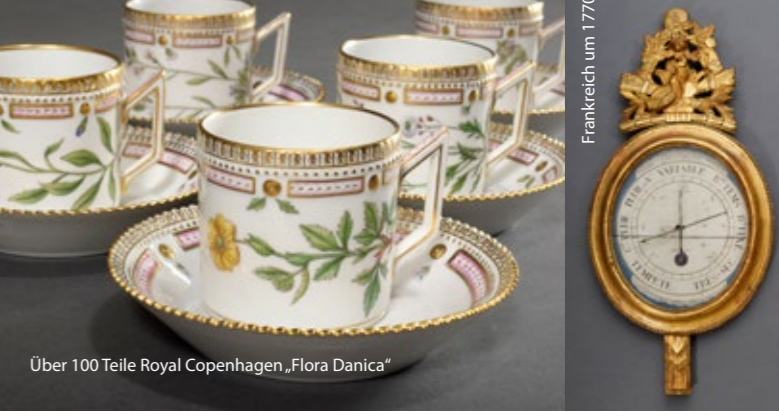
Über 100 Teile Royal Copenhagen „Flora Danica“

SAMSTAG, 10. SEPT. 2022 10.00 Uhr Gemälde, Zeichnungen, Graphik, Foto, Plastik (770 - 1097) ca. 14.00 Uhr Asiatika, Ethnographika, Antiken (1098 - 1279) ca. 16.15 Uhr Porzellan, Keramik, Glas (1280 - 1535) Zur Versteigerung kommen, im Auftrag der Testamentsvollstrecker sowie im Auf- trag von Erben und freiwilligen Auftraggebern, Antiquitäten und Kunstgegenstände. Online-Katalog: www.auktion-kendzia.de