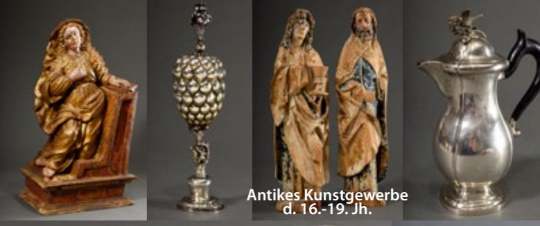
Antikes Kunstgewerbe d. 16.-19. Jh.

ZEITPLAN Abweichungen vom Zeitplan sind möglich! FREITAG, 09. SEPT. 2022 10.00 Uhr Nautika, Militaria, Bücher, Spielzeug, Musik, Vintage, Objets d'Art, Varia, Sakrales, Metall (1 - 225) ca. 12.45 Uhr Silber, Plated, Besteck (226 - 419) ca. 15.00 Uhr Schmuck, Uhr (420 - 658) ca. 18.00 Uhr Möbel, Lampe, Spiegel, Rahmen, Teppiche (659 - 769)