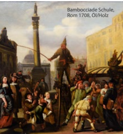
Bambocciade Schule, Rom 1708, Öl/Holz

Samstag, 10. September 2022 ab 10.00 Uhr