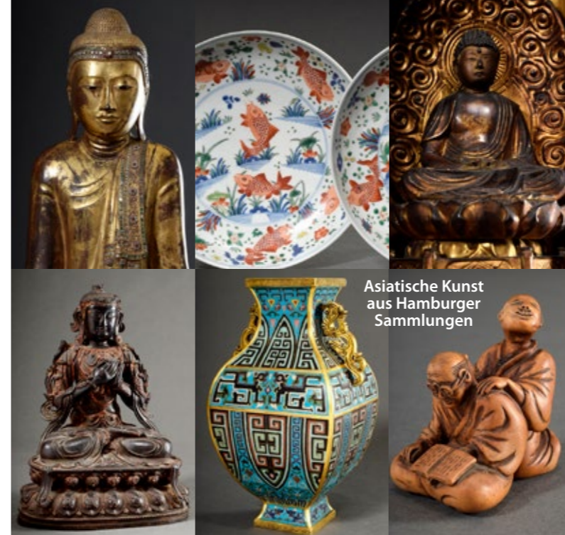
Asiatische Kunst aus Hamburger Sammlungen