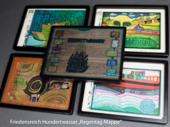
Friedensreich Hundertwasser „Regentag Mappe“