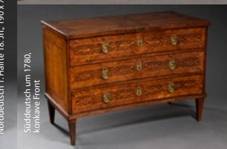
Süddeutsch um 1780, konkave Front