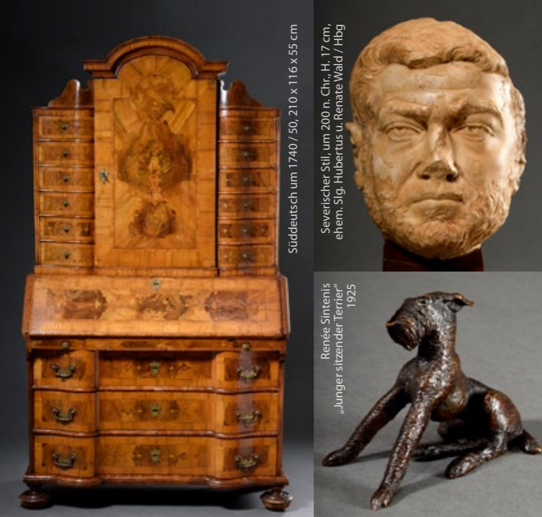
Süddeutsch um 1740 / 50, 210 x 116 x 55 cm