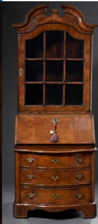
Norddeutsch 1. Hälfte 18. Jh., 190 x 72 x 57 cm