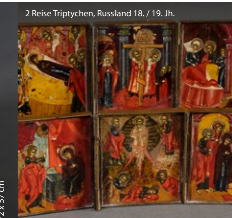
2 Reise Triptychen, Russland 18. / 19. Jh.