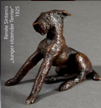
Renée Sintenis „Junger sitzender Terrier“ 1925