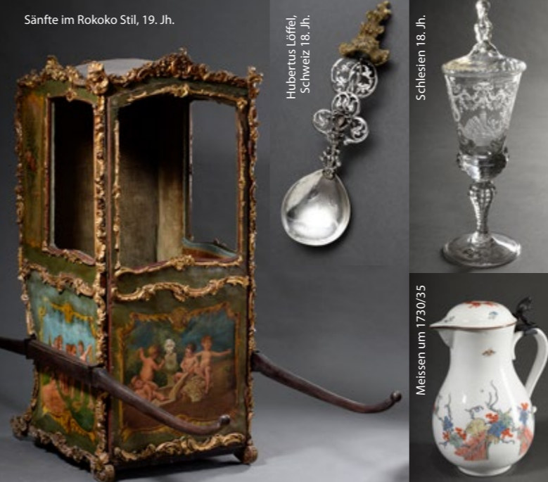
Sänfte im Rokoko Stil, 19. Jh.