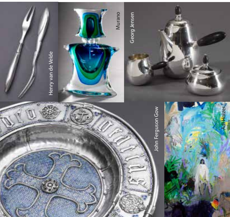
Henry van de Velde