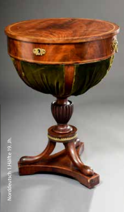
Norddeutsch, 1. Hälfte 19. Jh.