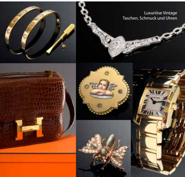
Luxuriöse Vintage Taschen, Schmuck und Uhren