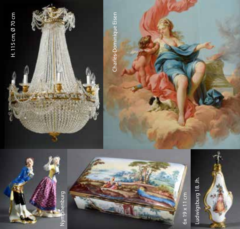
H. 115 cm, Ø 70 cm