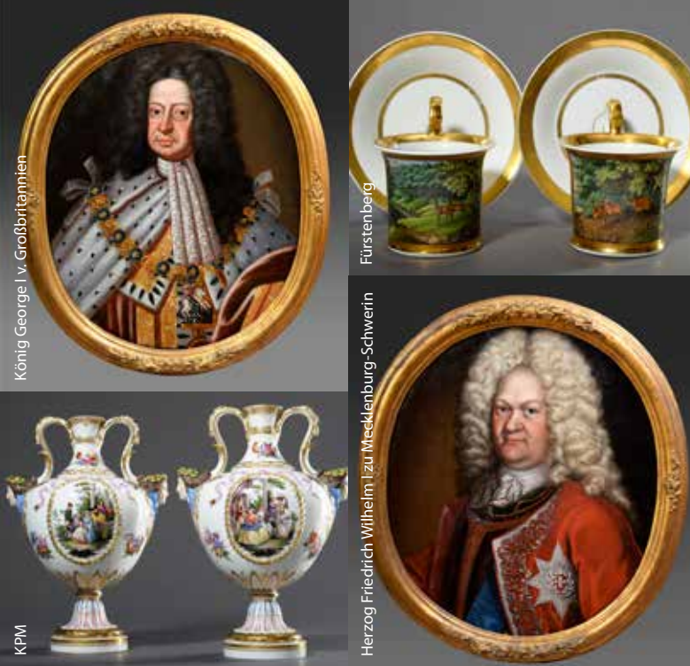
König George I.v. Großbritannien