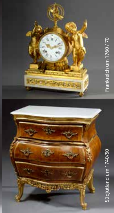
Südjylland um 1740/50