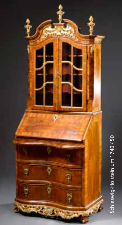
Schleswig-Holstein um 1740 / 50

Samstag, 21. November 2020 ab 10.00 Uhr Kunst & Antiquitäten