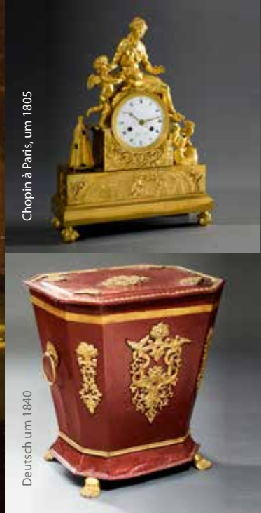
Chopin à Paris, um 1805