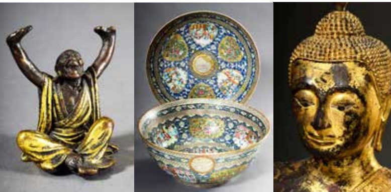
Asiatische Kunst aus alten Sammlungen