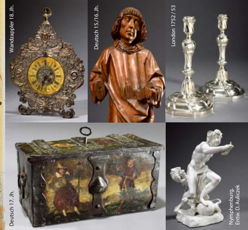
Wandzappler 18. Jh.