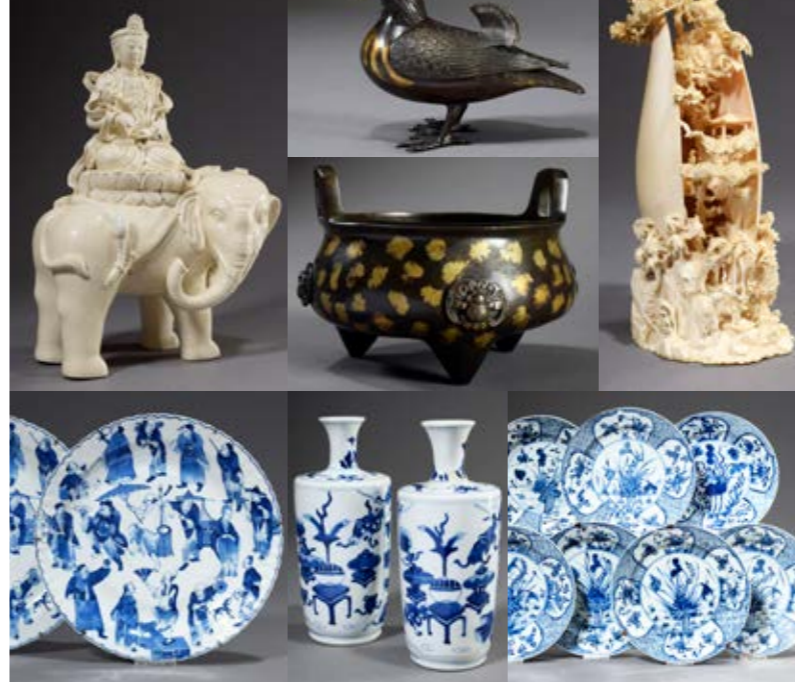
Aus unserem Angebot an asiatischer Kunst