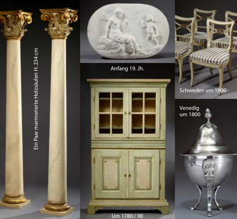
Ein Paar marmorierte Holzsäulen H. 234 cm