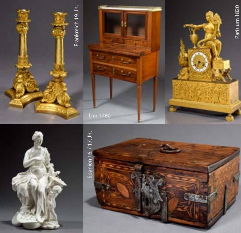
Frankreich 19. Jh.