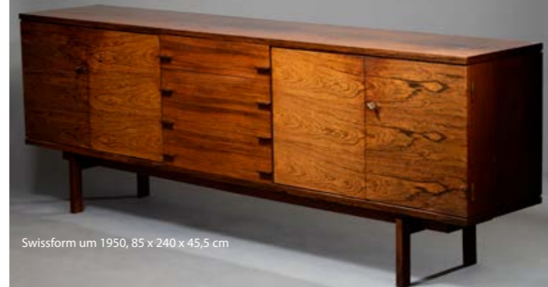
Swissform um 1950, 85 x 240 x 45,5 cm