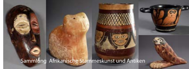
Sammlung Afrikanische Stammeskunst und Antiken