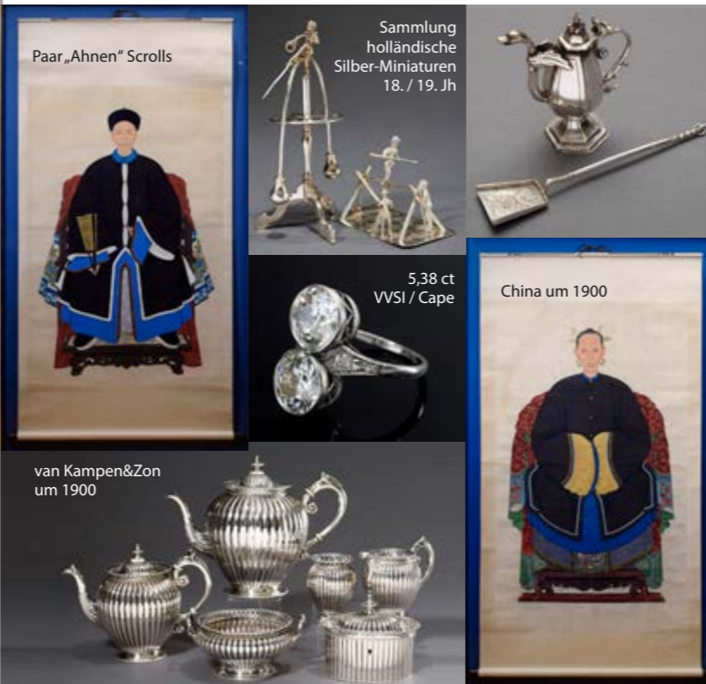
Paar „Ahnenn“ Scrolls

Für Fragen stehen wir Ihnen gerne zur Verfügung Ihr Kendzia Team